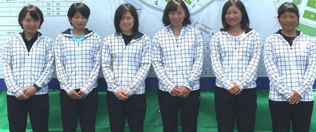
心を一つに戦ったチームダンロップ!!

7/30(土)~31(日)、愛媛県において「第60回 全日本実業団選手権大会」が開催され日本リーグ、実業団リーグの14チームによる団体戦が行われました。